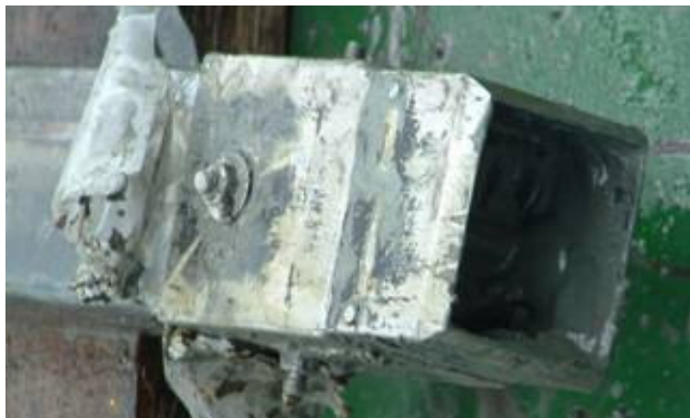
Foto N° 2: Zapata de corte de sección cuadrada con clapeta de cierre

Para evitar la contaminación de la muestra con la chapa de hierro del tubo que se utiliza para el muestreo, colocamos un tubo de polietileno de la misma sección interna del tubo que se utiliza como receptor de la muestra que se extrae, el que se fija en su parte inferior mediante los tornillos que ajustan la cabeza de corte con el tubo porta muestra, tal como se puede apreciar también en la foto N° 1.