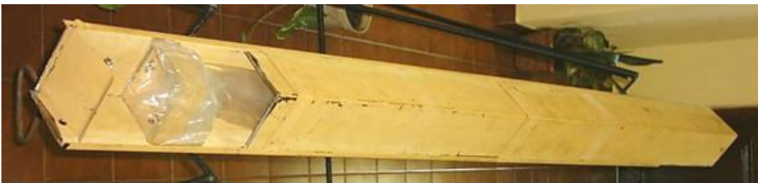
Foto N° 4: Extracción de la tapa superior del sacamuestras partido de sección cuadrada