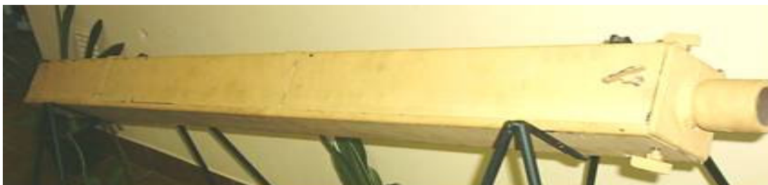
Foto N° 3: Muestrador de 1,50 m de largo y de sección cuadrada de 100 cm 2 , cortado longitudinalmente según sus diagonales

Teniendo en cuenta las dimensiones de la cabeza de corte y la presencia en el interior del sacamuestras de un recipiente tubular de polietileno de 150 \mu de espesor, que preserva y contiene a la muestra y evita que la misma se desagregue cuando se levanta hasta la superficie, podemos decir que de acuerdo a a la norma ASTM D 4823, el sacamuestras que se presenta tiene un coeficientes de áreas definidos en la norma de C_a = 8\% ( < 10\% ) y un factor de fricción interna de C_i = 0.39\% ( < 0,5\% ).