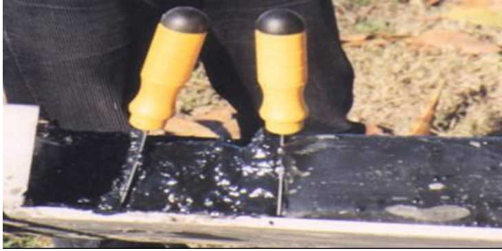
Foto N° 7: Muestra contaminada, una vez que se le ha quitado la membrana de polietileno lista para proceder a su muestreo