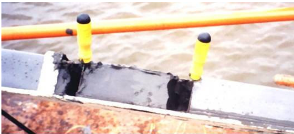
Foto N° 6: Sacamuestras de las fotos N° 3 y 4 al que se le a quitado la parte superior deslizante quedando la muestra expuesta dentro del film de polietileno

En las fotos N° 6 se aprecia como queda la muestra de barro contenida en el film de polietileno una vez que se retira la parte superior del sacamuestras, en éste caso se colocaban cuchillas de acero inoxidable esterilizadas para delimitar el sector en el que se iba a realizar el muestreo.